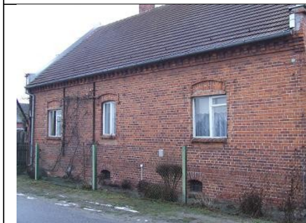
Elewacja z cegły