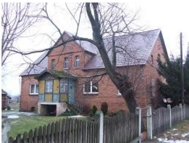
Budynek mieszkalny nr 5

Zdjęcia 16, 17, 18, 19, 20, 21 – Przykładowe budynki wpisane do Wojewódzkiej Ewidencji Zabytków.