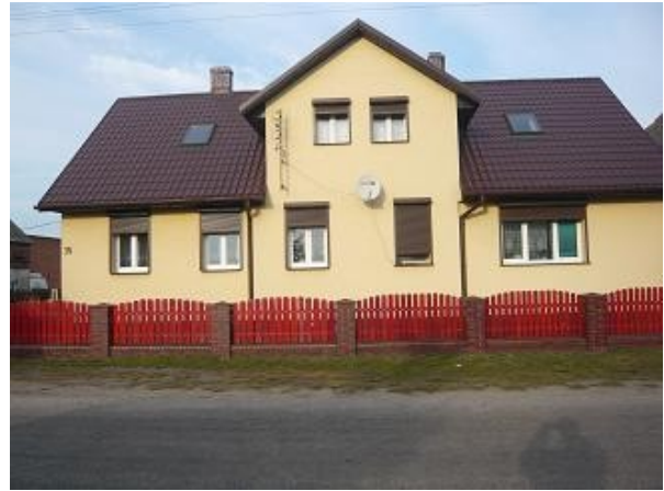
Budynek mieszkalny nr 15