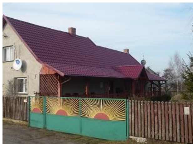
Budynek mieszkalny nr 11