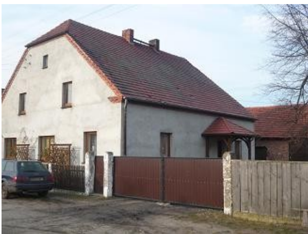
Budynek mieszkalny nr 17