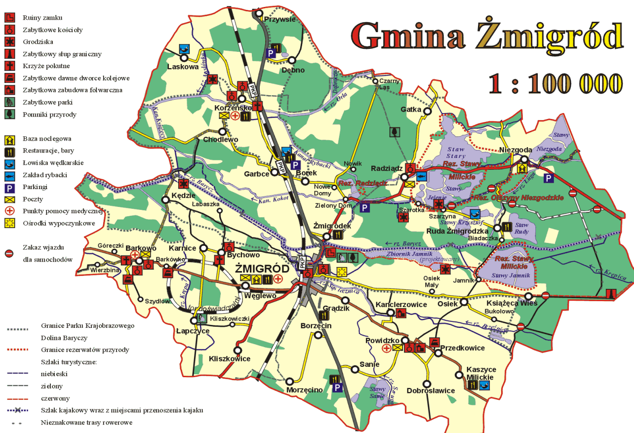
Rys 1. Lokalizacja miejscowości Borek na tle Gminy Żmigród.