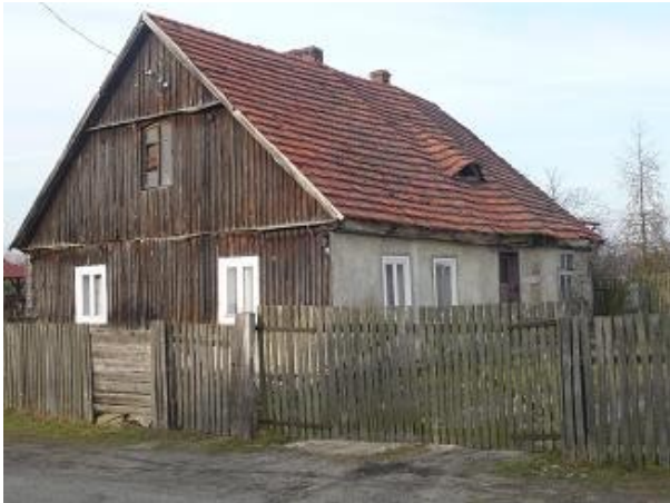
Budynek mieszkalny nr 13