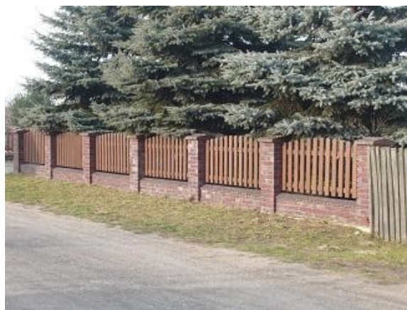
Połączenie drewna i cegły