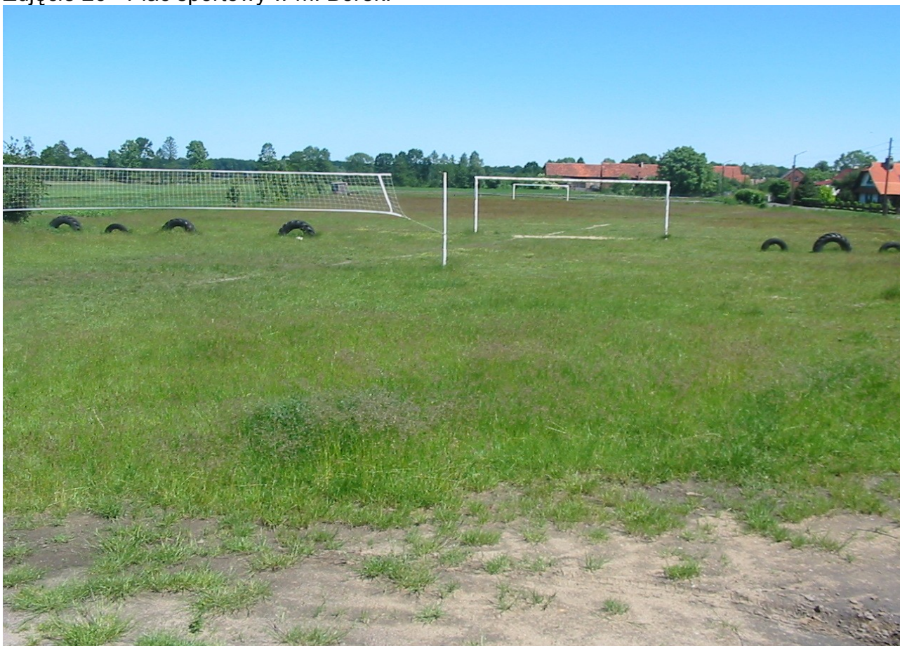
Zdjęcie 26 - Plac sportowy w m. Borek.

Świetlica pełnić będzie rolę miejsca zebrań wiejskich, Rady Sołectkiej, spotkań młodzieży szkolnej. Świetlica stanie się także siedzibą i miejscem spotkań Stowarzyszenia. Nowy budynek stymulować będzie rozwój kulturalny i zaspokajać potrzeby lokalnej społeczności w zakresie dostępu do kultury w sołectwie. Stale