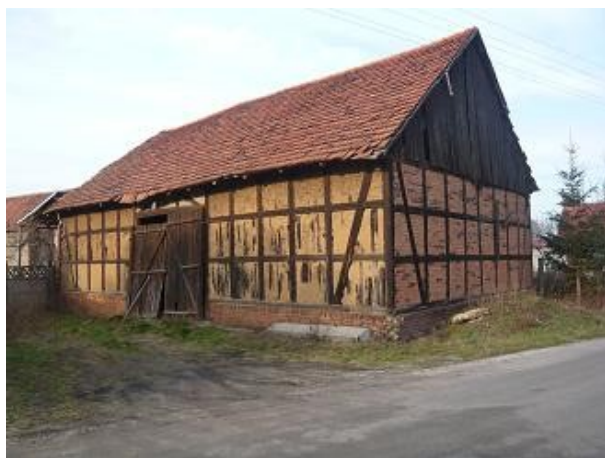
Stodoła pod nr 20