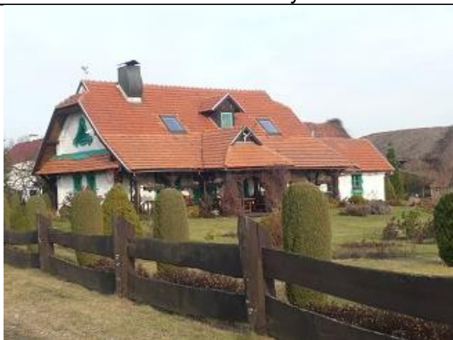
Dach z dachówki

Stan techniczny budynków we wsi jest różny, przeważająca liczba obiektów jest w stanie średnim. Na obiektach sprzed 1945 widać znaki czasu, szczególnie na tych o które się mniej dba. Jednakże ogólny odbiór zabudowy we wsi jest bardzo pozytywny. Nie występuje tu tendencja kategorycznego zaniedbywania domostw przez ich właścicieli.