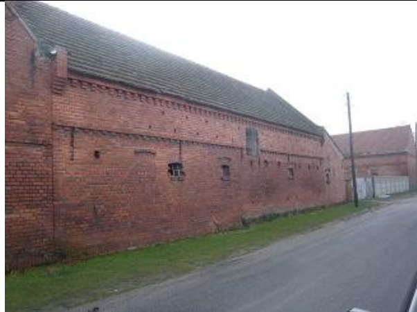
Elewacja z cegły