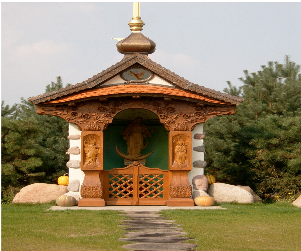
Zdjęcie 1. Przydrożna kapliczka.

Oprócz tego nie ma tu tak charakterystycznych obiektów zabytkowych, które spotykamy w innych wsiach Gminy Żmigród. Uwagę zwracają też z jednej strony dawna zabudowa, z drugiej nowe posesje, często fantazyjne, nawiązujące jednak do klasycznej architektury. Już nowe posesje wykazują, że Borek może stać się ciekawym dla ludzi szukających spokoju w otoczeniu nieskażonej przyrody, tak dla celów rekreacyjnych (sezonowe domki itd.) jak i osiedleńczych.