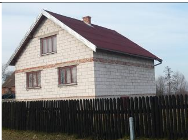
Dach z blachy

Zdjęcia 6,7,8 – Przykładowe rodzaje pokryć dachowych.