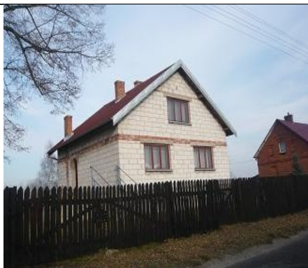
Elewacja z betonu komórkowego