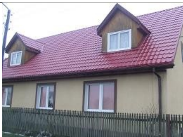
Dach z blachodachówki