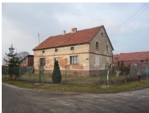
Budynek mieszkalny nr 9