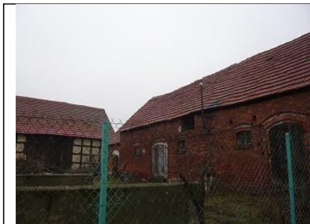
Budynek gospodarczy z cegły i szafulca