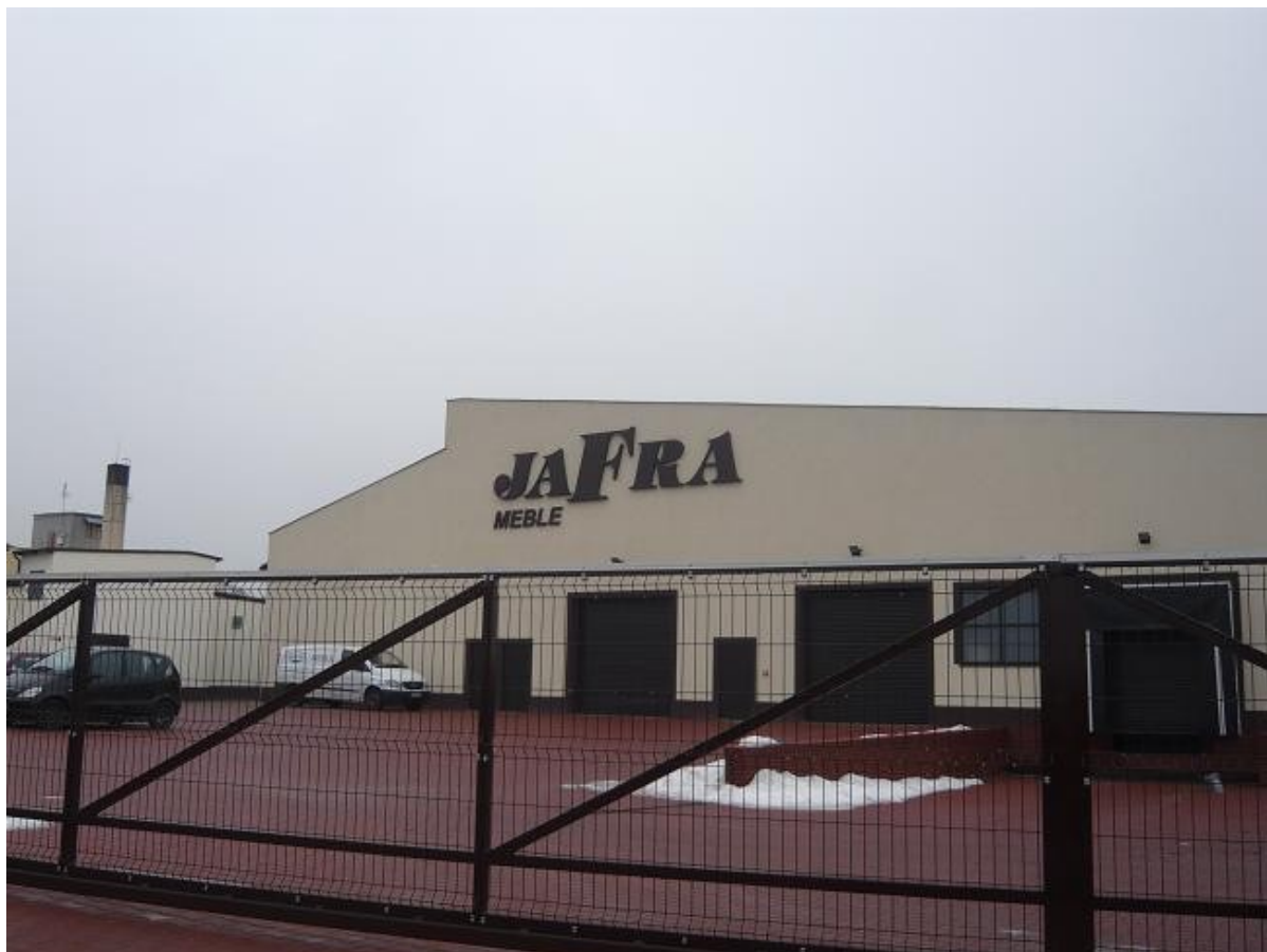
Zdjęcie 1 - Przedsiębiorstwo JAFRA

Ponadto na wyróżnienie zasługują dwa kilkudziesięciohektarowe gospodarstwa, zajmujące się produkcją warzyw oraz tuczem drobiu. Mamy tu jednak do czynienia ze swoistym kontrastem gospodarczym. Z jednej strony jedna z najprężniejszych firm w gminie oraz dobrze prosperujące gospodarstwa, z drugiej duże problemy terenów dawnych Państwowych Gospodarstw Rolnych.