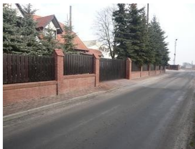
Połączenie drewna i cegły