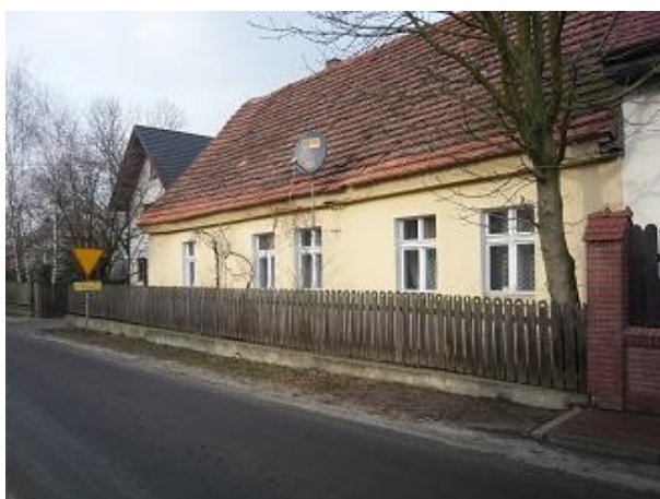
Budynek mieszkalny nr 2

Zdjęcia 15, 16, 17 – Przykładowe budynki wpisane do Wojewódzkiej Ewidencji Zabytków.