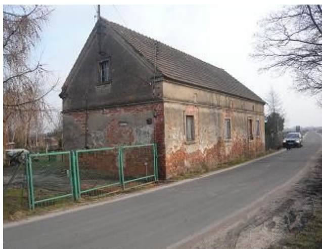
Budynek mieszkalny nr 25