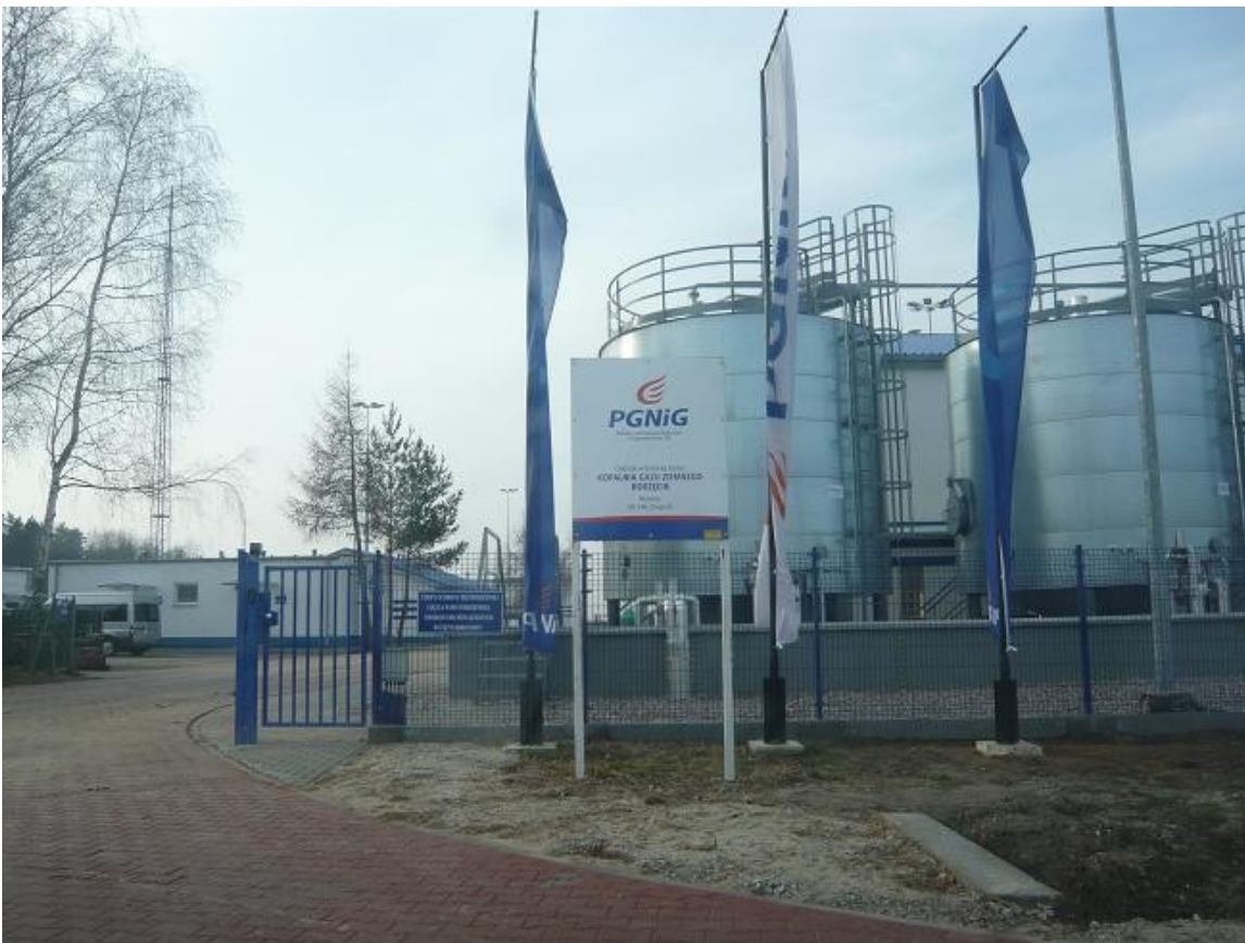
Zdjęcie 2 - Kopalnia gazu ziemnego - PGNiG

miejsowości przebiega trasa jednego z nielicznych w Europie Toru Doświadczalnego, zarządzanego przez Centrum Naukowe Techniki Kolejnictwa w Warszawie. Ponadto w południowej części sołectwa znajdują się złoża oraz kopalnia gazu ziemnego, eksploatowane przez Polskie Górnictwo Naftowe i Gazownictwo.