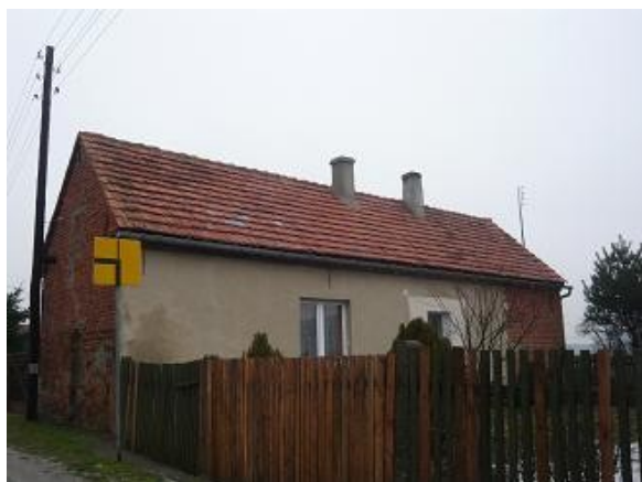
Elewacja z cegły i tynku

Zdjęcie 3,4,5: Przykładowe elewacje budynków