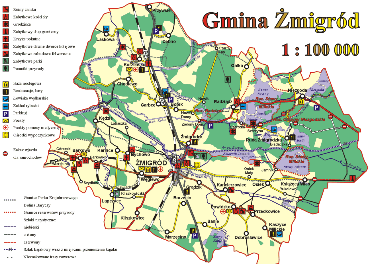
Rys 1. Lokalizacja miejscowości Karnice na tle Gminy Żmigród.