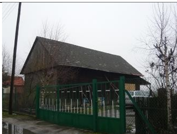
Budynek gospodarczy drewniany