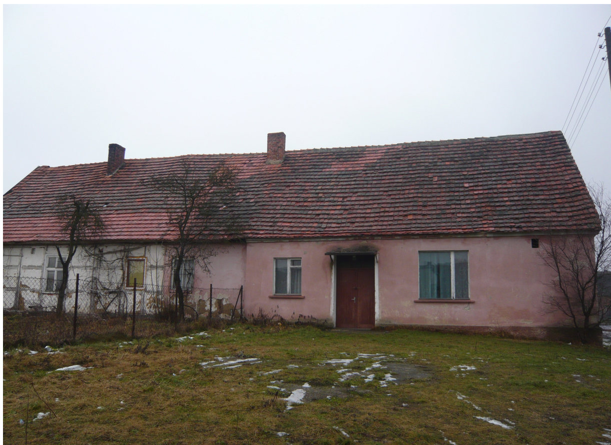
Zdjęcie 9. Budynek starej świetlicy.

W centrum wsi znajduje się stary budynek, który częściowo był zaadaptowany na świetlicę wiejską. Ze względu na postępujące zniszczenie lokal ten od kilku lat jest nieużyteczny.