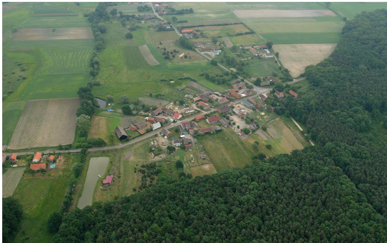
Zdjęcie 1. Zdjęcie lotnicze wsi Kędzie.

Po lewej stronie za mostem na Baryczy znajdują się pozostałości dawnego grodziska z okresu kultury łużyckiej oraz roztacza się piękny widok na miejsca podmokłe, malownicze łąki i drzewostany chronione jako użytek ekologiczny. Całej wsi towarzyszy klimat spokoju.