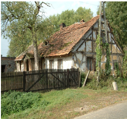
Zdjęcia 9, 10, 11, 12, 13, 14. Przykładowe domy mieszkalne wpisane do Wojewódzkiej Ewidencji Zabytków i rejestru Zabytków Gminy Żmigród.