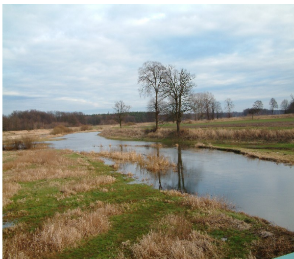
Zdjęcie 2 i 3. Tereny wokół rzeki Barycz.

Po lewej stronie za mostem na Baryczy znajdują się pozostałości dawnego grodziska z okresu kultury łużyckiej oraz roztacza się piękny widok na miejsca podmokłe, malownicze łąki i drzewostany chronione jako użytek ekologiczny. Całej wsi towarzyszy klimat spokoju.