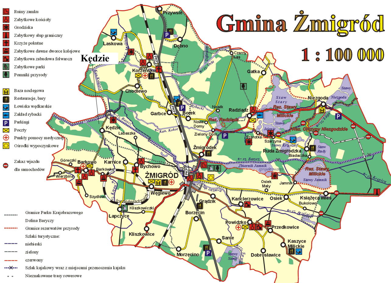
Rys 1. Lokalizacja miejscowości Kędzie na tle Gminy Żmigród