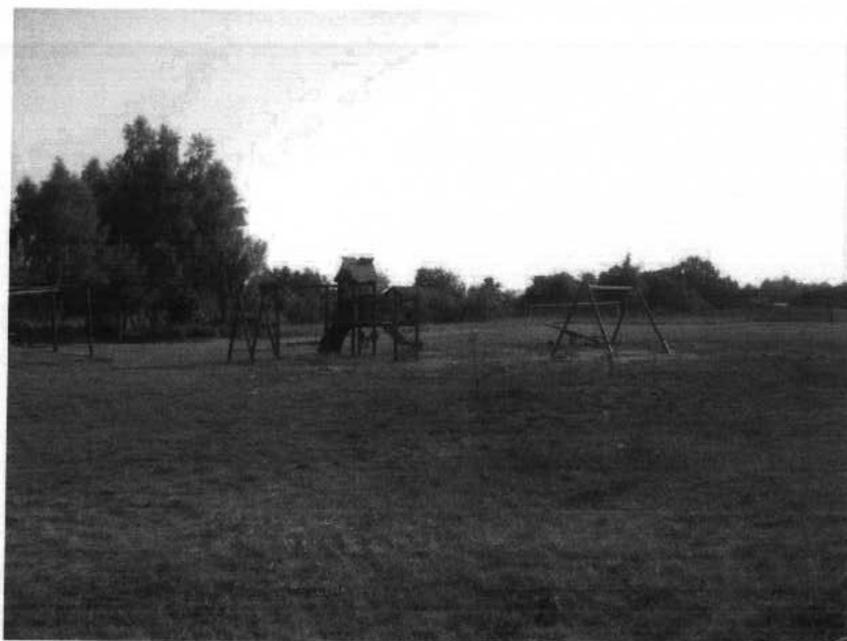
Zdjęcie 5. Plac zabaw i boisko do siatkówki.