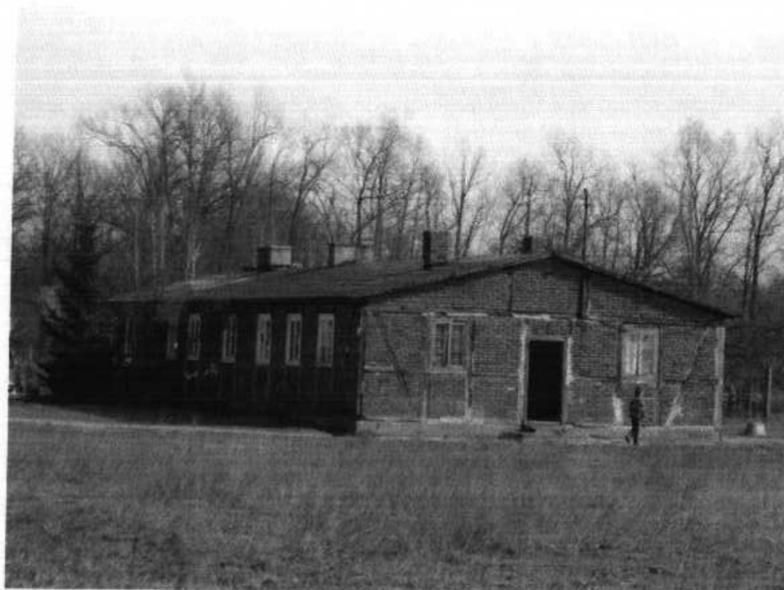
Zdjęcie 1. Budynek komendantury obozu

Na skraju lasu stoi murowana kapliczka przydrożna z 1929 r., zwieńczona krzyżem. W podstawie prostokątna wnęka a w niej figura Chrystusa.