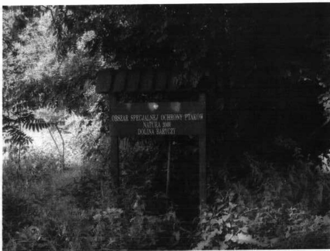
Zdjęcie 3. Obszar Specjalnej Ochrony Ptaków NATURA 2000 Doliny Baryczy