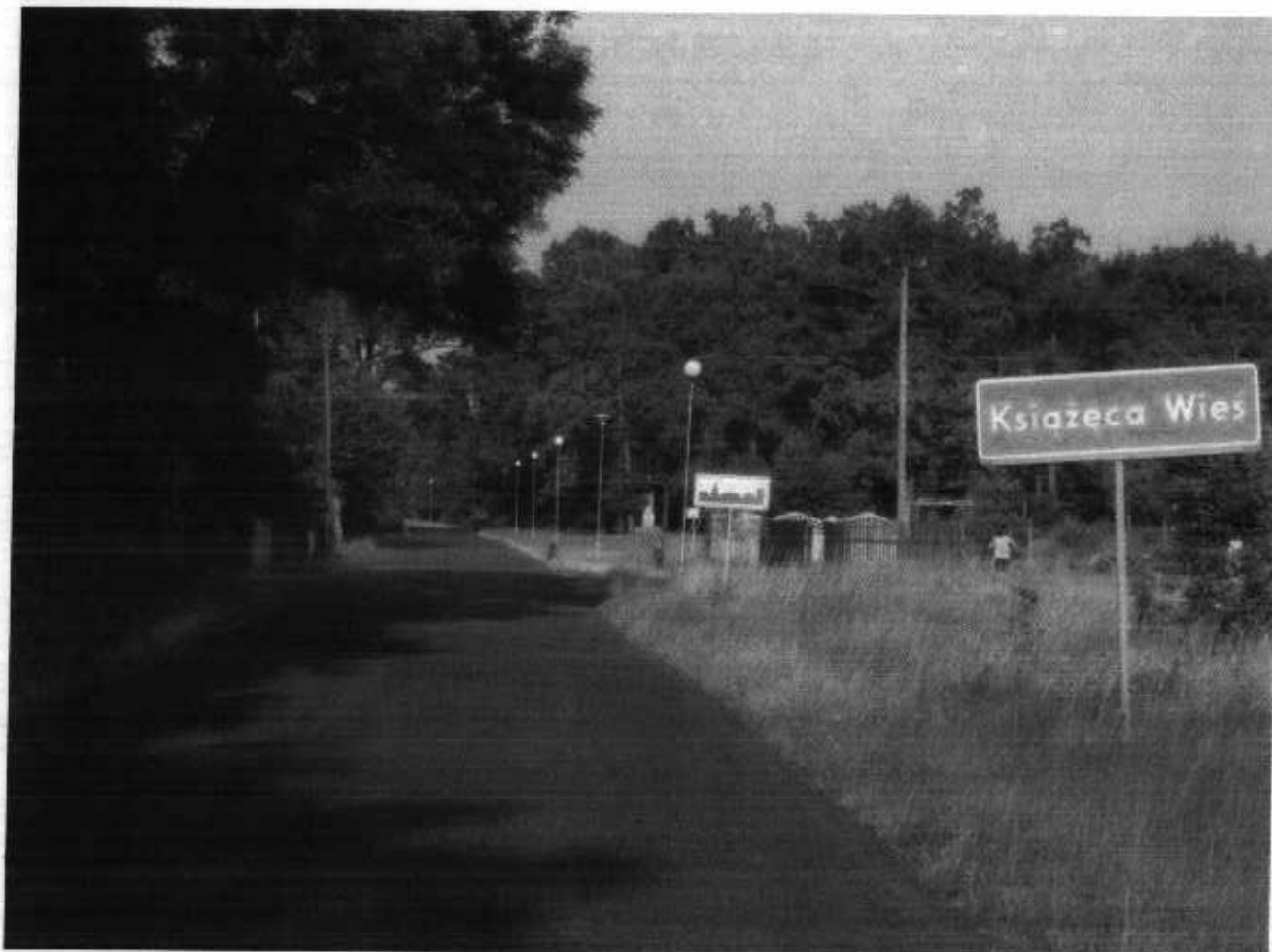
Zdjęcie 4. Oświetlenie uliczne

Wieś jest całkowicie zelektryfikowana, posiada telefony stacjonarne oraz sieć wodociągową. Charakterystyczną cechą miejscowości, która wyróżnia Książęcą Wieś wśród żmigrodzkich sołectw jest istniejące oświetlenie uliczne w stylu parkowym. Oświetlenie dodaje dodatkowego turystycznego uroku.