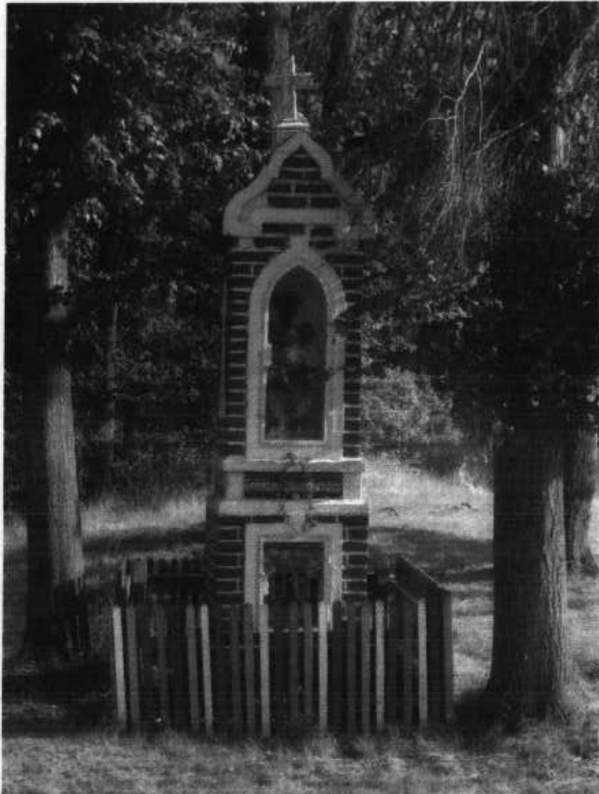
Zdjęcie 2. Przydrożna Kapliczka.

Na początku wsi znajduje się kapliczka Najświętszej Marii Panny, przed którą odbywają się nabożeństwa.