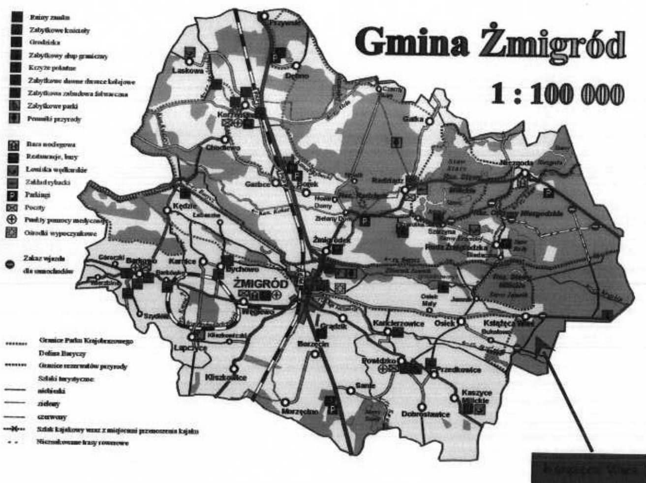
Rys 1. Lokalizacja miejscowości Książęca Wieś na tle Gminy Żmigród