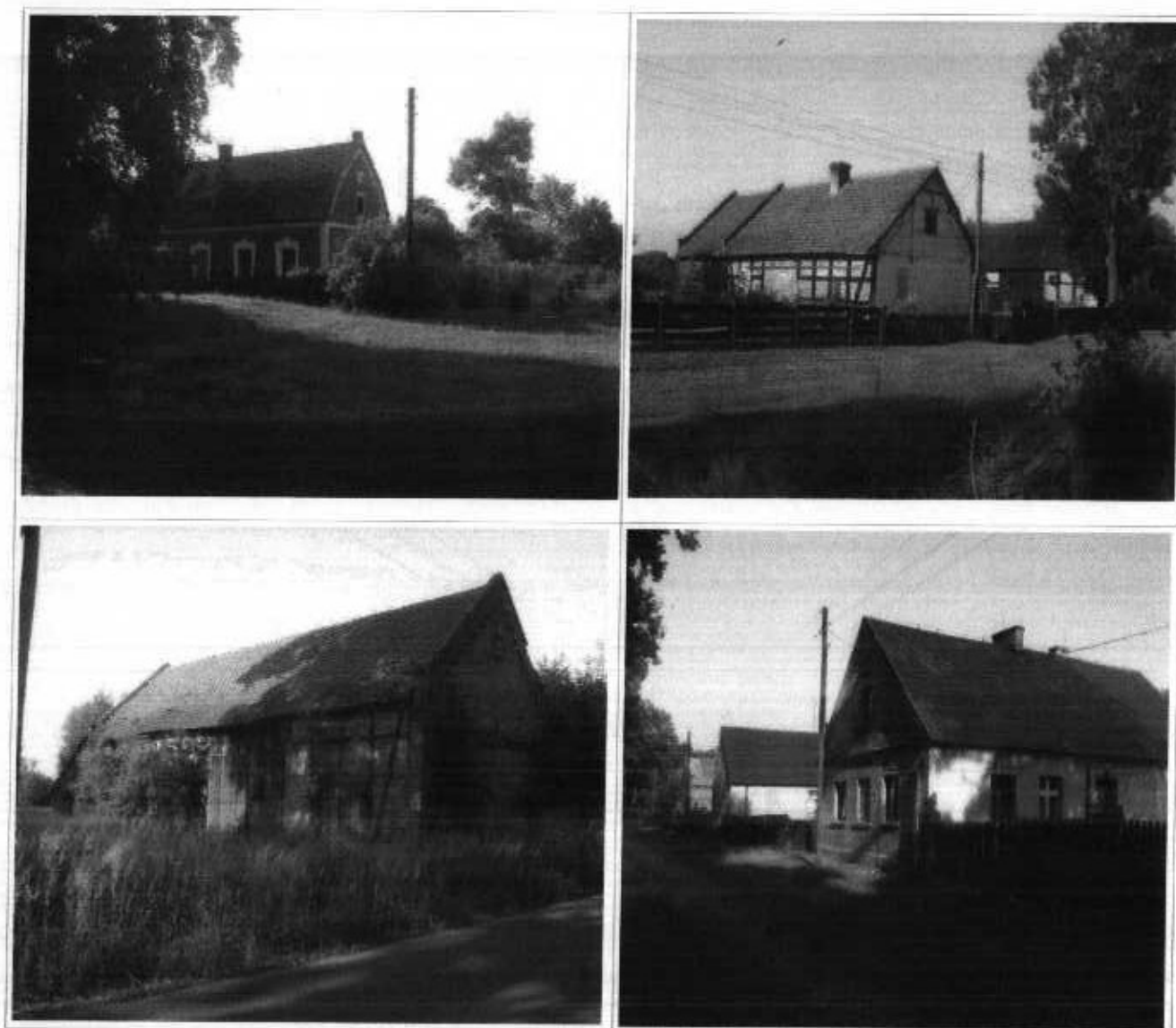
Zdjęcia 6, 7, 8, 9. Przykładowe budynki w Książęcej Wsi.

Biorąc pod uwagę kąty nachylenia dachów w miejscowości panuje porządek. Występują tu praktycznie budynki, których kąt nachylenia połaci dachowych wynosi 45^{\circ} . We wsi dominują dachy pokryte czerwoną dachówką. Oprócz tradycyjnego pokrycia budynków – dachówką, występują także budynki z pokryciem blacho dachówką i blachą.