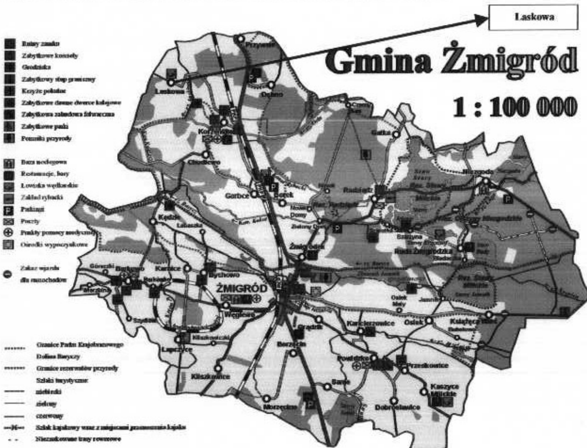
Rys. 1 Lokalizacja miejscowości Laskowa na tle Gminy Żmigród