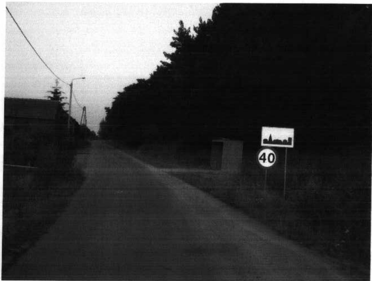
Zdjęcie 2. Widok wioski od strony północnej

Krzysztofa Nogałę. Piasek z kopalni wykorzystywany jest do produkcji kostki betonowej w pobliskim Przedsiębiorstwie Produkcji Betonów „Kaczmarek” Sp. z o. o. oraz na potrzeby mieszkańców gminy Żmigród.