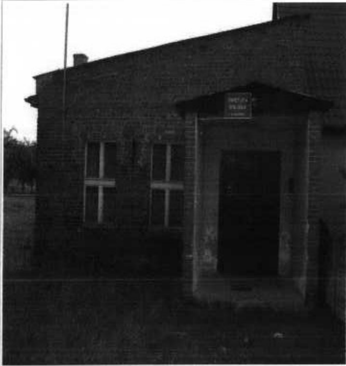
Zdjęcia 7, 8, i 9. Przykładowe budynki wpisane do Wojewódzkiej Ewidencji Zabytków i rejestru Zabytków Gminy Żmigród