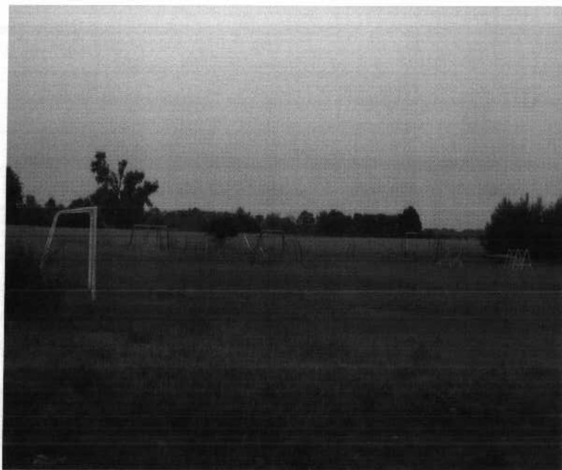
Zdjęcie 6. Plac zabaw w m. Laskowa.