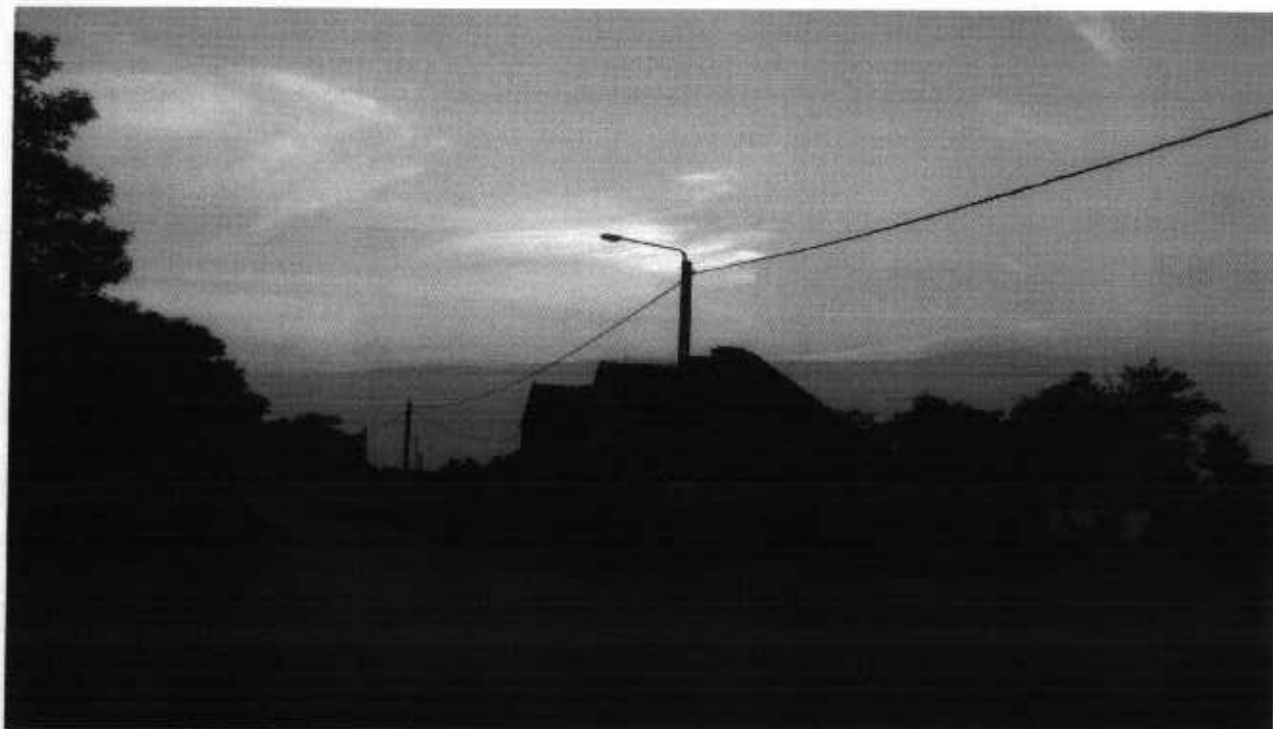
Zdjęcie 3 i 4. Zabudowa gospodarstw we wsi Laskowa

Oznacza to, że mieszkańcy wsi Laskowa prowadzą małe, rodzinne gospodarstwa nie nastawione na szerszą działalność rolniczą.