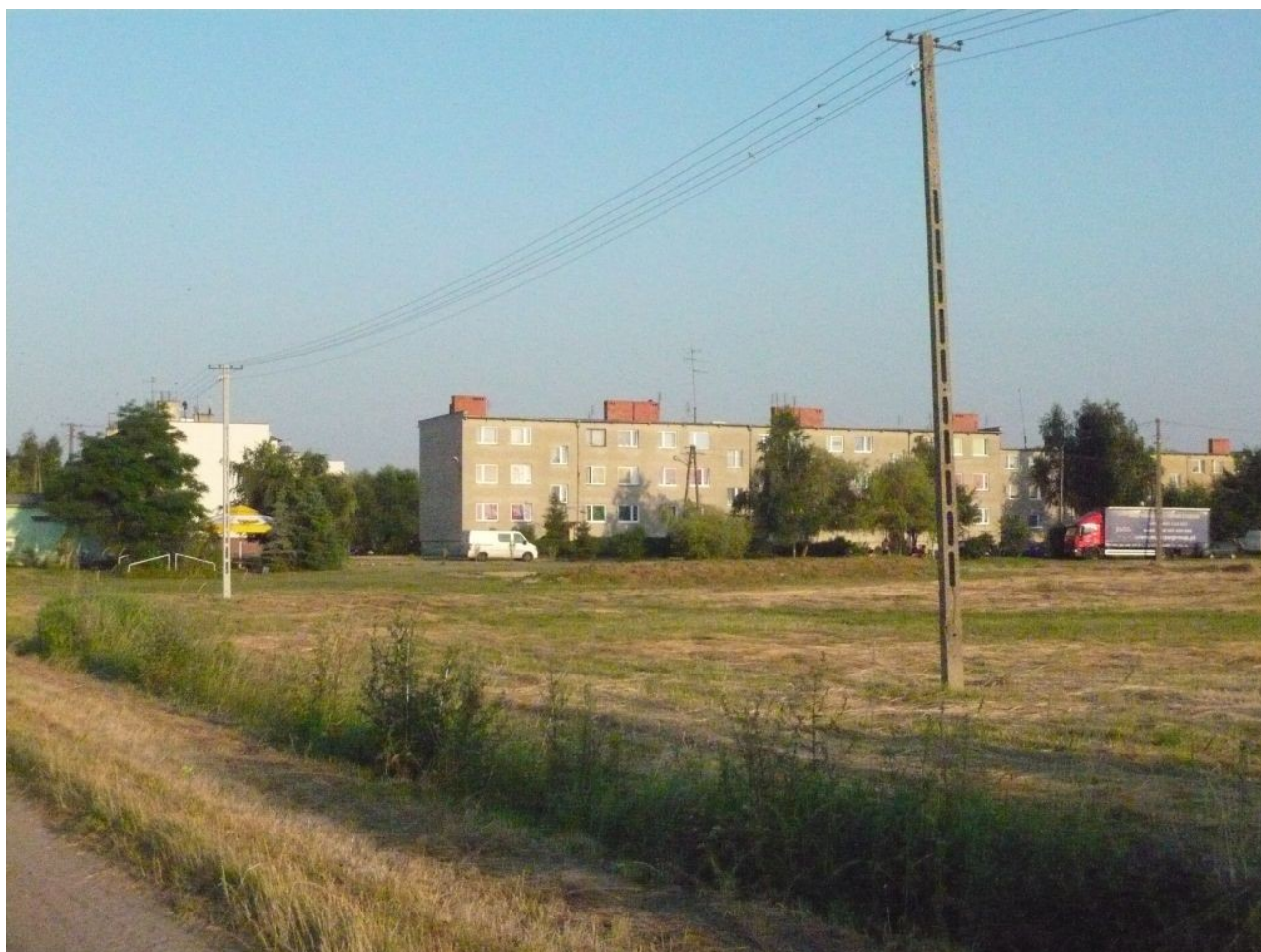
Zdjęcie 10. Osiedle – „błoki”

We wsi występuje stara zabudowa (np. drewniana) jak również elewacje wykonane z cegły i betonowych prefabrykatów. Całkowity chaos w zabudowę miejscowości wniosły 4 budynki wielorodzinne powstałe w latach 70 dla ówczesnych pracowników PGR-u. Na tzw. „błokach” znajdują się 72 mieszkania, które zamieszkuje połowa lokalnej ludności.