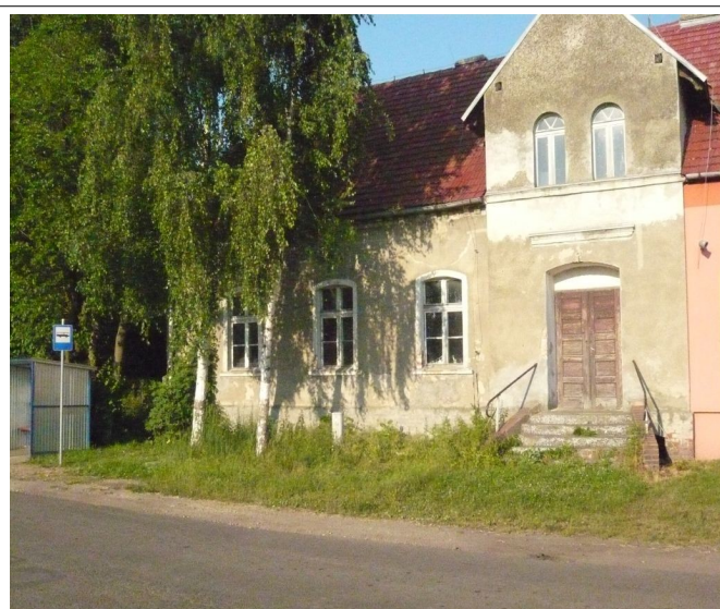
Zdjęcia 6, 7, 8, 9. Przykładowe budynki w Kaszycach Milickich.