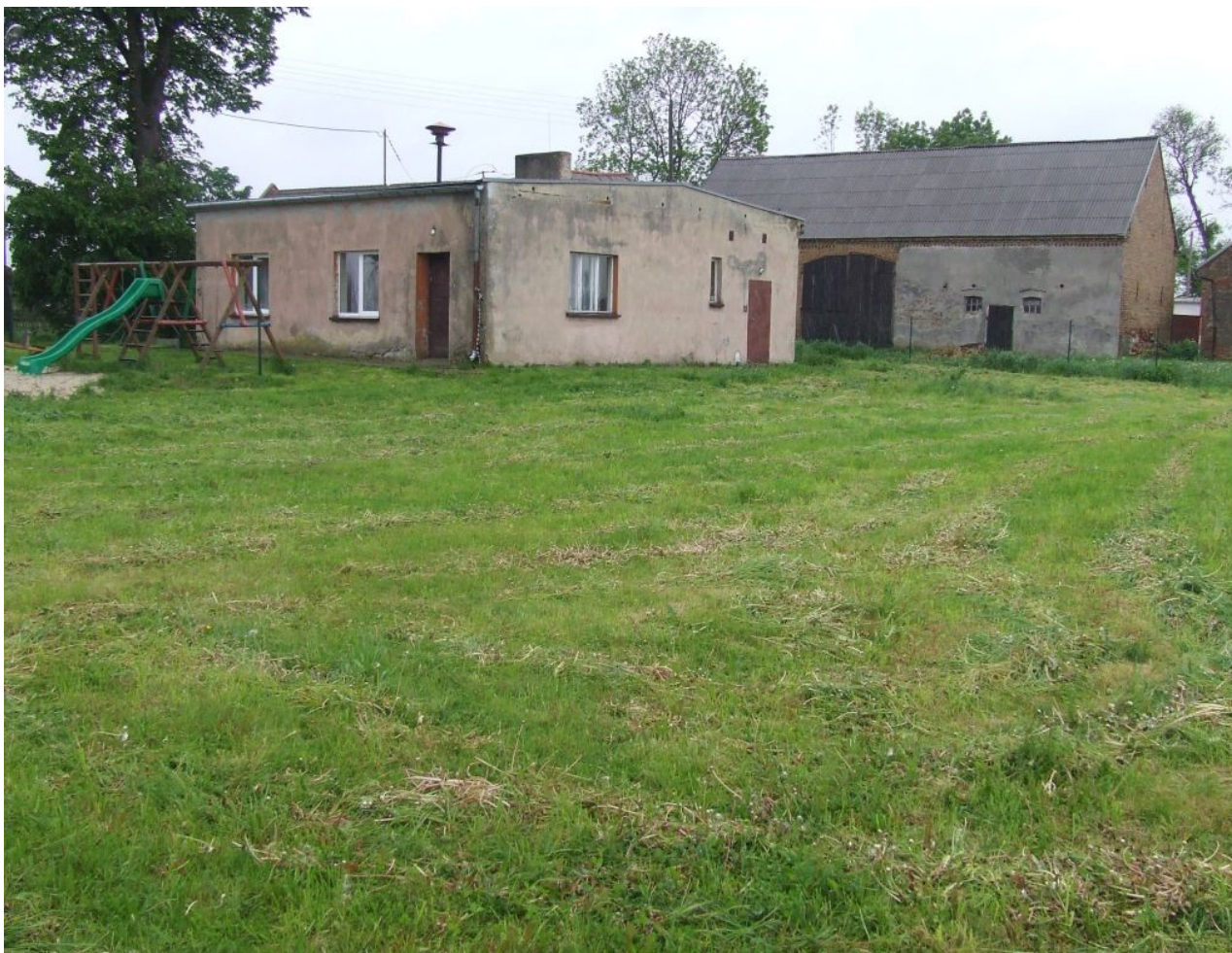
Zdjęcie 5. Remiza strażacka – świetlica wiejska