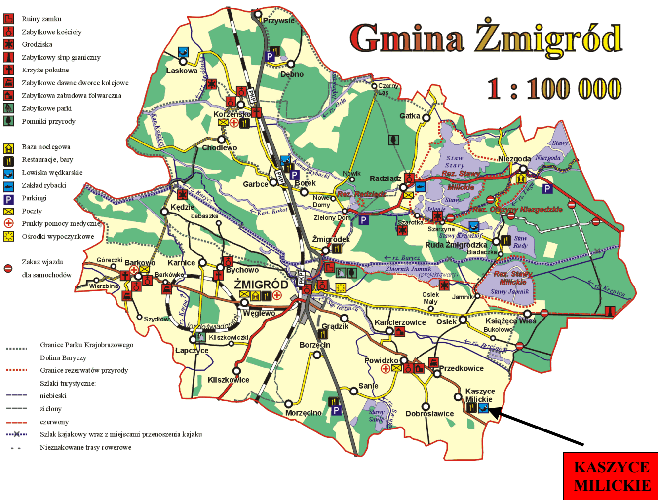
Rys 1. Lokalizacja miejscowości Kaszyce Milickie na tle Gminy Żmigród