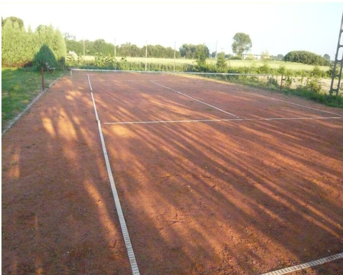
Zdjęcie 4. Prywatny kort tenisowy.