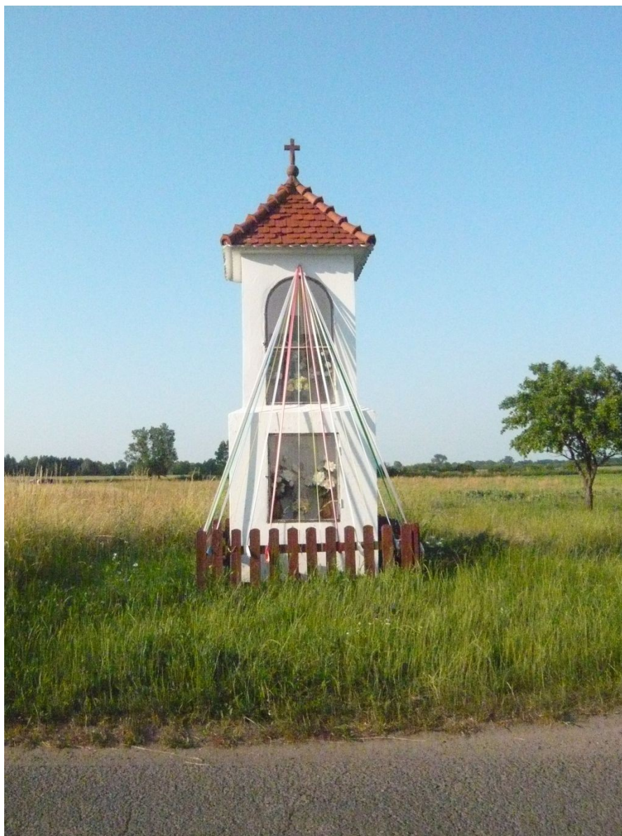
Zdjęcie 1. Przydrożna Kapliczka.

Na początku wsi znajduje się kapliczka Najświętszej Marii Panny, przed którą odbywają się nabożeństwa.