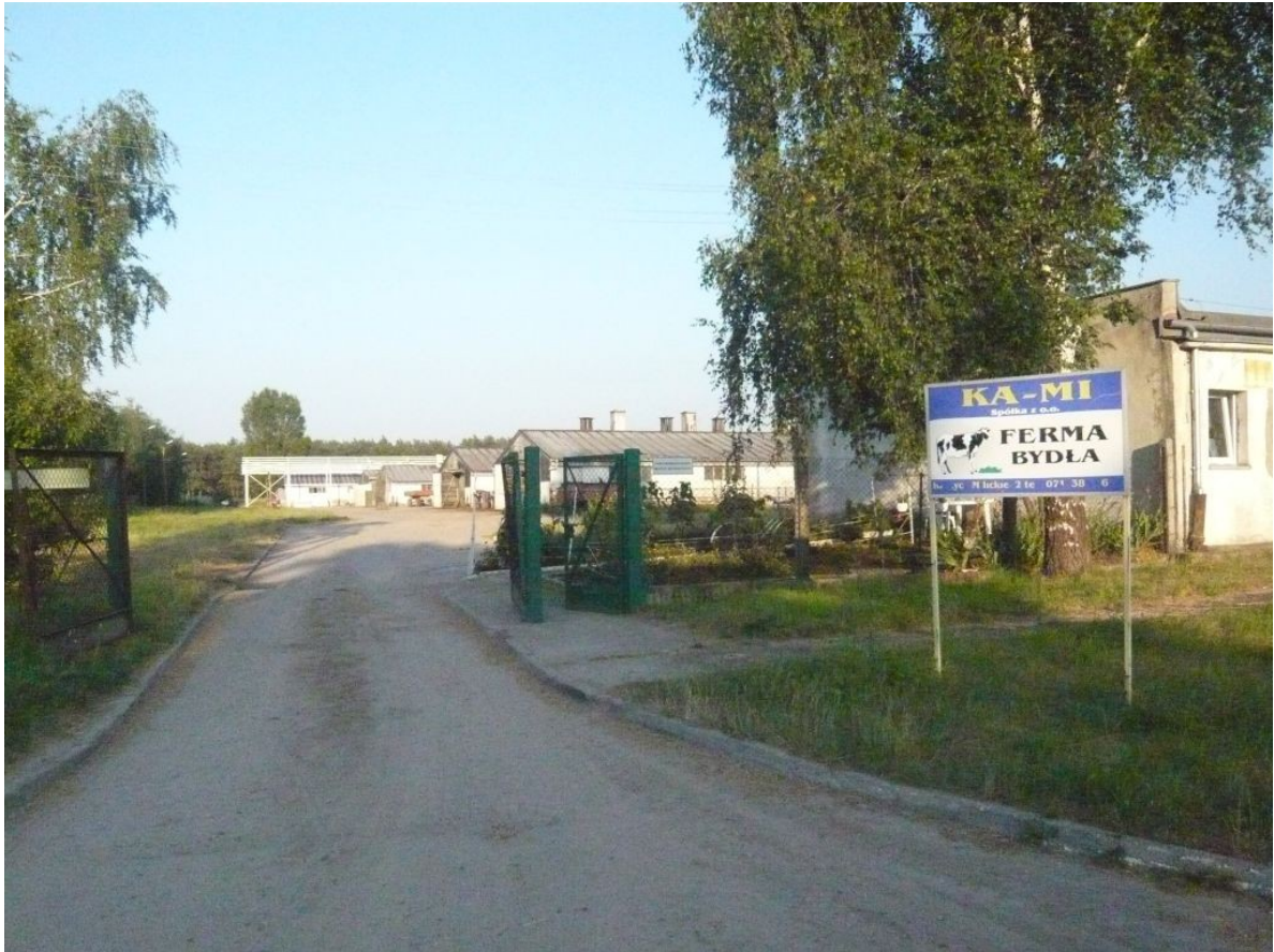
Zdjęcie 3. Ferma bydła.