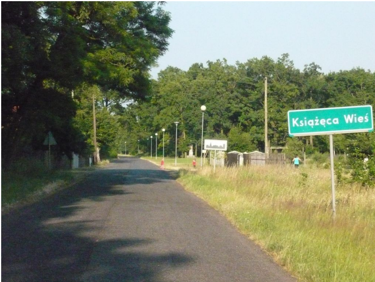
Zdjęcie 4. Oświetlenie uliczne

Charakterystyczną cechą miejscowości, która wyróżnia Książęcą Wieś wśród żmigrodzkich sołectw jest istniejące oświetlenie uliczne w stylu parkowym. Oświetlenie dodaje dodatkowego turystycznego uroku.