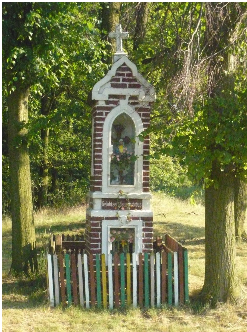
Zdjęcie 2. Przydrożna Kapliczka.

Na początku wsi znajduje się kapliczka Najświętszej Marii Panny, przed którą odbywają się nabożeństwa.