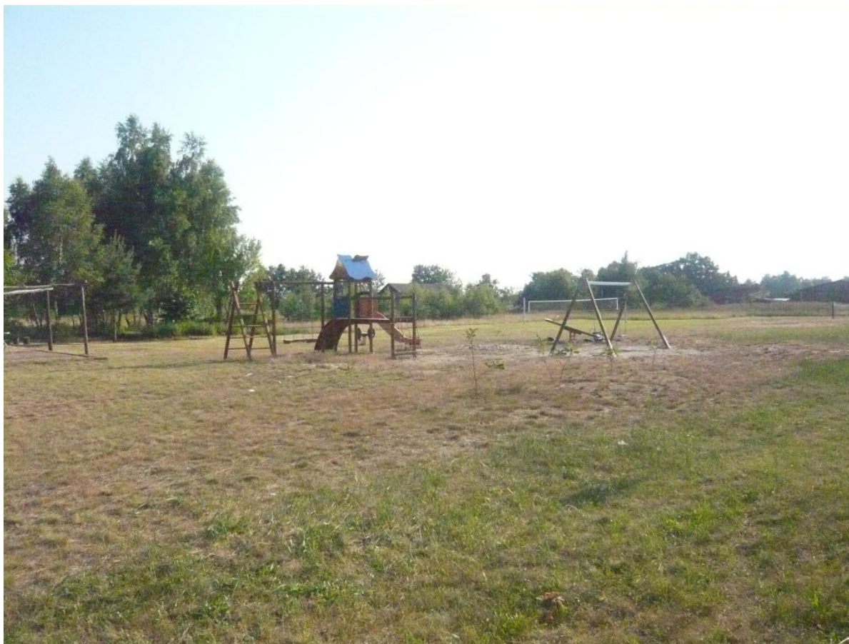
Zdjęcie 5. Plac zabaw i boisko do siatkówki.