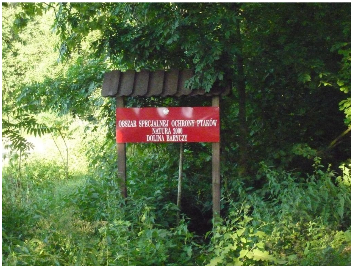
Zdjęcie 3. Obszar Specjalnej Ochrony Ptaków NATURA 2000 Doliny Baryczy