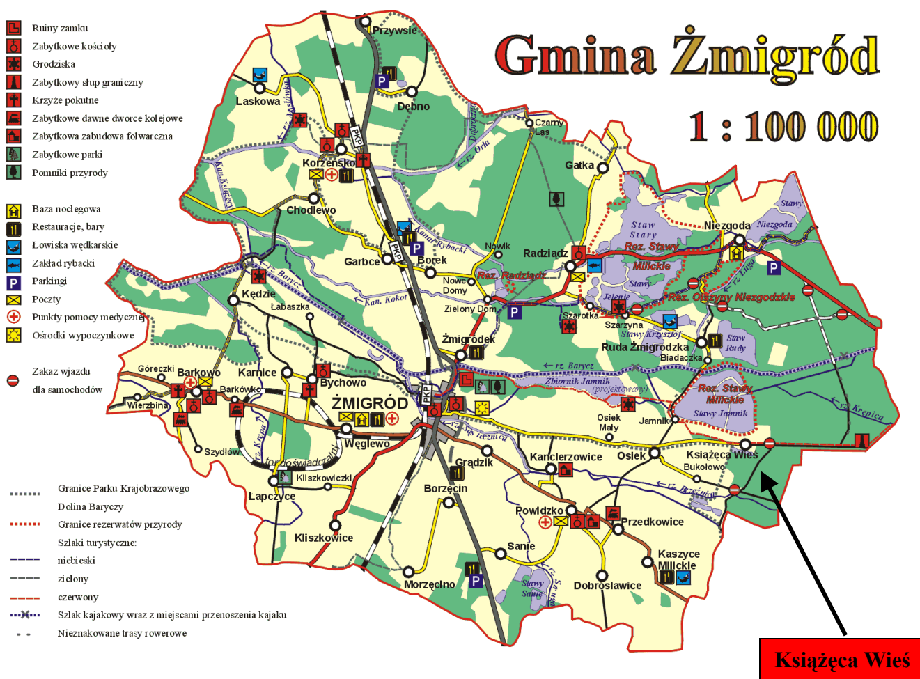
Rys 1. Lokalizacja miejscowości Książęca Wieś na tle Gminy Żmigród