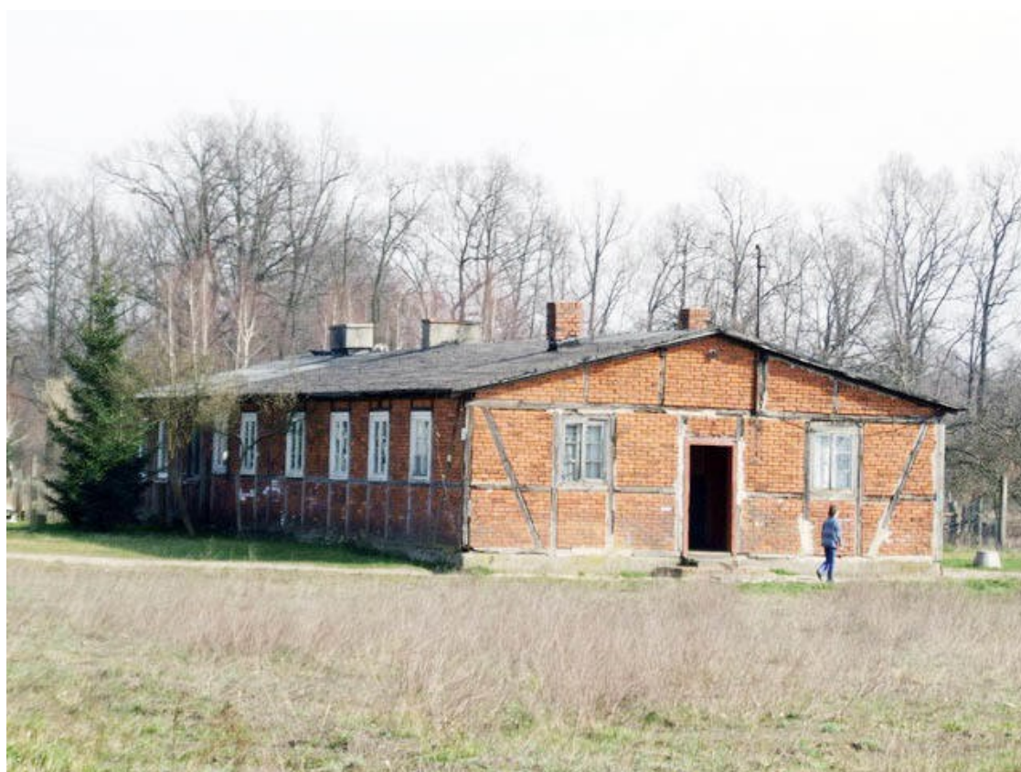
Zdjęcie 1. Budynek komendantury obozu

Na skraju lasu stoi murowana kapliczka przydrożna z 1929 r., zwieńczona krzyżem. W podstawie prostokątna wnęka a w niej figura Chrystusa.