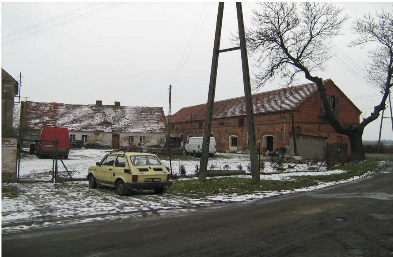
Zdjęcie 4 i 5. Zabudowa gospodarstw we wsi Borzęcin