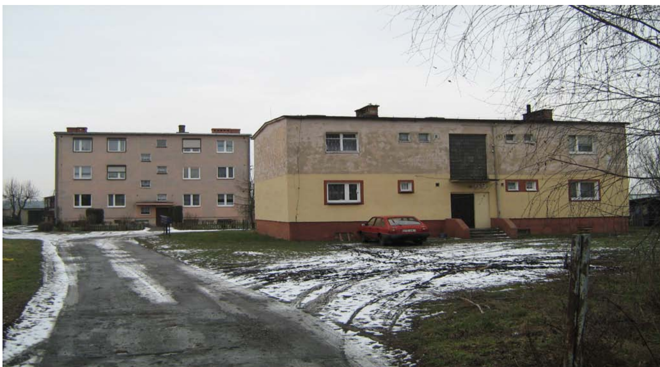
Zdjęcie 2. Bloki byłego Państwowego Gospodarstwa Rolnego

Po II wojnie światowej w miejscowości Borzęcin powstało Państwowe Gospodarstwo Rolne które zmieniło krajobraz wsi. Na przełomie lat 70 i 80 na zlecenie władz Państwowego Gospodarstwa Rolnego w Borzęcinie przy drodze krajowej nr 5 powstały bloki dla pracowników PGR-u. Zespół czterech bloków o konstrukcji murowanej w formie kostki oraz jeden czworak zmieniły całkowicie obraz miejscowości.