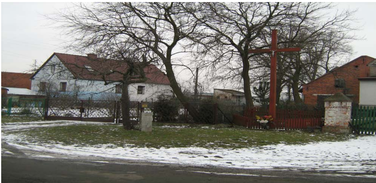
Zdjęcie 1. Zabudowa miejscowości Borzęcin

Po II wojnie światowej w miejscowości Borzęcin powstało Państwowe Gospodarstwo Rolne które zmieniło krajobraz wsi. Na przełomie lat 70 i 80 na zlecenie władz Państwowego Gospodarstwa Rolnego w Borzęcinie przy drodze krajowej nr 5 powstały bloki dla pracowników PGR-u. Zespół czterech bloków o konstrukcji murowanej w formie kostki oraz jeden czworak zmieniły całkowicie obraz miejscowości.