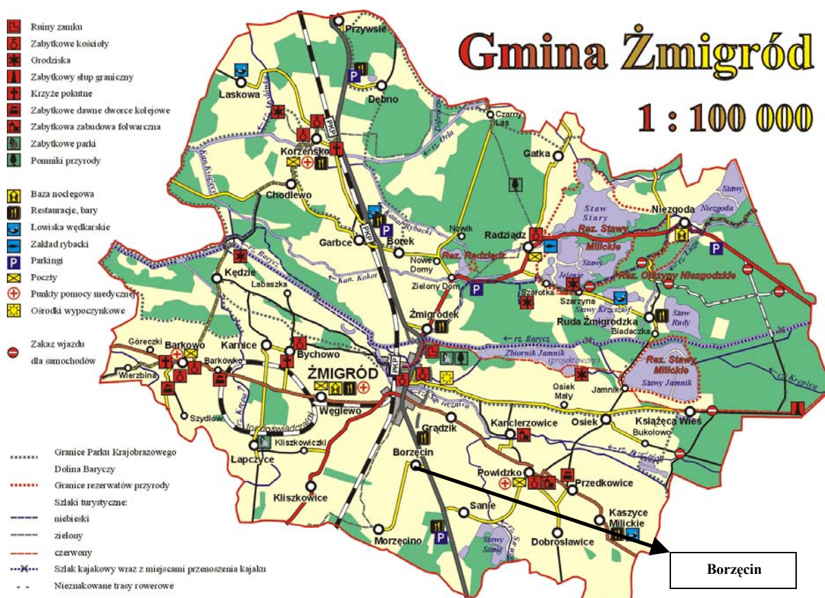
Rys. 1 Lokalizacja miejscowości Borzęcin na tle Gminy Żmigród