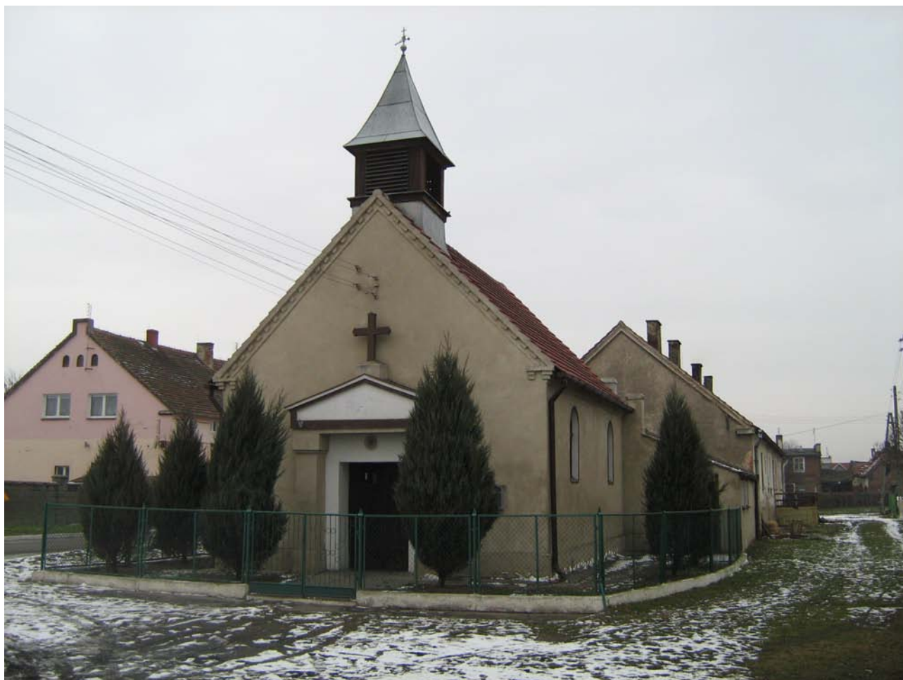
Zdjęcie 3. Kaplica pod wezwaniem Św. Jadwigi

W centrum miejscowości znajduje się Kaplica pod wezwaniem Św. Jadwigi, z roku 1912 w której odprawiane są nabożeństwa w każdą niedzielę.