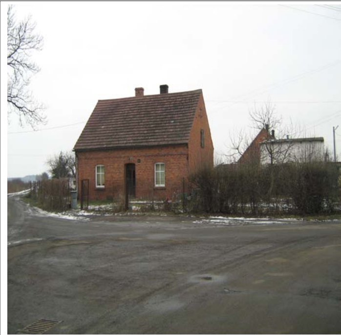
Zdjęcia 8, 9, 10 i 11. Przykładowe budynki wpisane do Wojewódzkiej Ewidencji Zabytków i rejestru Zabytków Gminy Żmigród