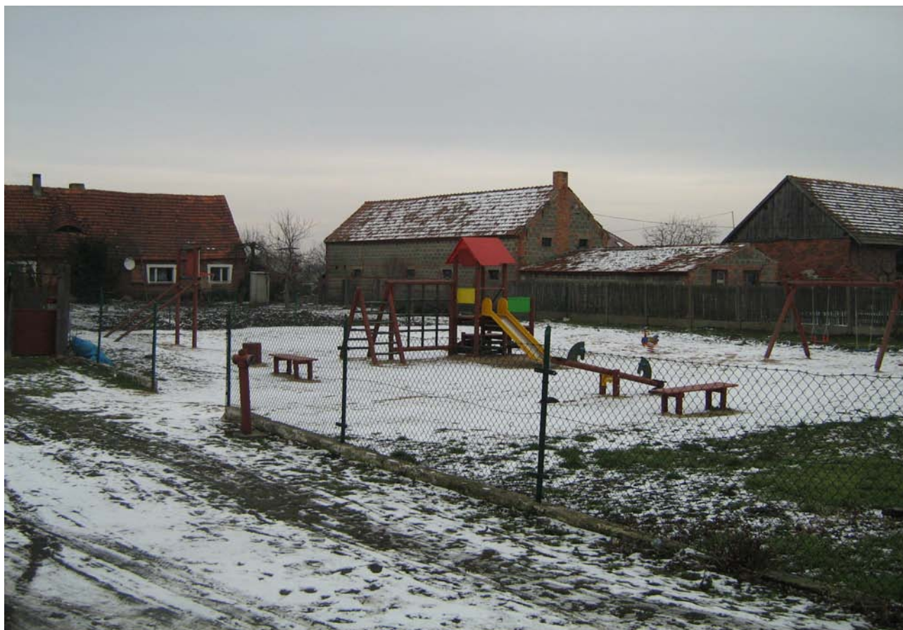
Zdjęcie 6. Plac zabaw w Borzęcinie.

W 2008 r. przy świetlicy wiejskiej powstał nowy plac zabaw. Dzięki inicjatywie mieszkańców teren wokół placu zabaw został uprzątnięty i ogrodzony.