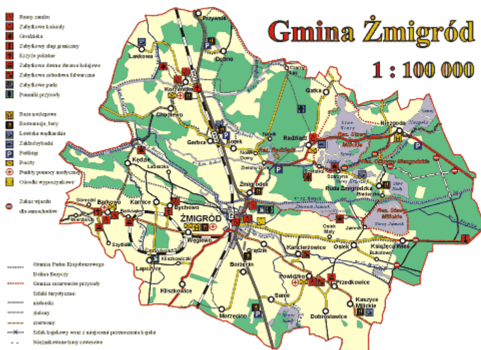
Rysunek 1. Mapa Gminy Żmigród

Miasto i Gmina Żmigród – należy do grupy gmin o charakterze miejsko-wiejskim jest w tej kategorii jedną z większych gmin województwa dolnośląskiego. Obszar Gminy wynosi 293.0 km 2 i jest zamieszkały przez 15 073 mieszkańców (stan na 31 grudnia 2009 r.), co plasuje gminę na 7 miejscu pod względem powierzchni oraz na 22 miejscu pod względem liczby mieszkańców w województwie dolnośląskim, spośród gmin wiejskich i miejsko-wiejskich. Gmina posiada wybitnie rolniczy charakter, składa się z 30 sołectw oraz centralnego ośrodka municypalnego miasta Żmigród, które jest największą i najliczniej zamieszkałą miejscowością gminy a zarazem siedzibą gminy oraz innych organów władzy samorządowej i państwowej. Samo miasto liczy 6 580 (stan na 31 grudnia 2009 r.) mieszkańców, tj. 43,66 % ogółu ludności gminy. Miasto pełni funkcje centrum gospodarczo - handlowo – administracyjnego. Na terenach wiejskich zamieszkuje 8 493 osób.(stan na 31 grudnia 2009 r.).