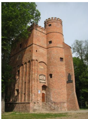
Rysunek 6. Baszta