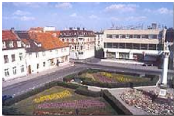
Rysunek 8. Rynek