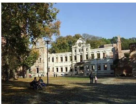
Rysunek 7. Zamek