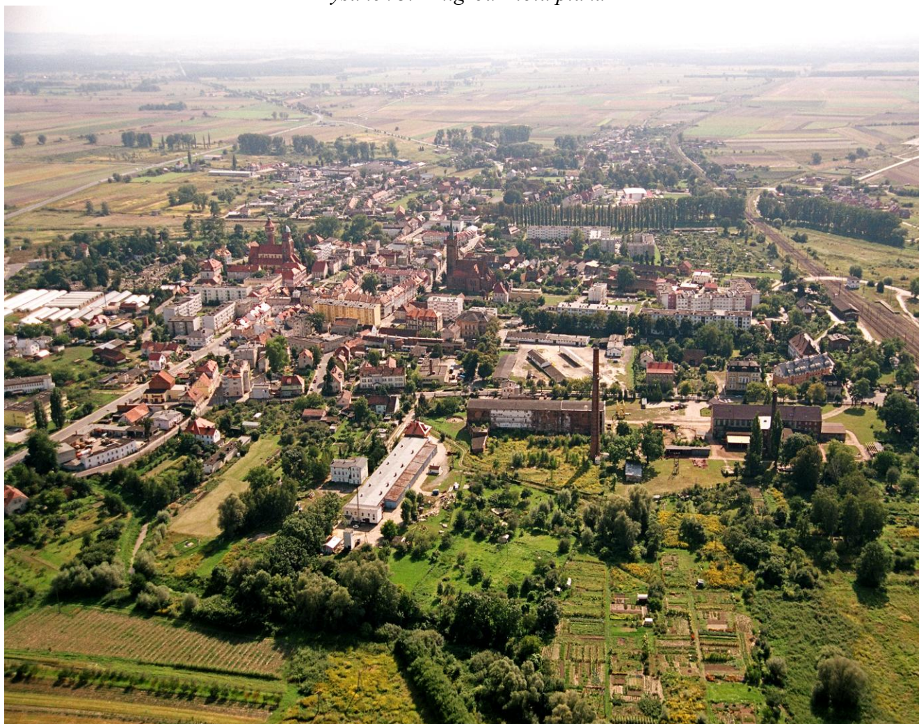
Rysunek 3. Żmigród z lotu ptaka

Gmina zajmuje południową część Kotliny Żmigrodzkiej, zaś północną stanowi obszar gminy Rawicz. Południowa część gminy różni się nieco od północnej gdyż należy do obszaru Równiny Prusickiej. Obszar ten w większości jest krainą rolniczą, czemu sprzyja klimat, jeden z najcieplejszych w Polsce. Średnie i słabe gleby nie sprzyjają specjalnie rolniczemu wykorzystaniu terenu, obszar Kotliny Żmigrodzkiej jest w znacznym stopniu zalesiony a większe kompleksy leśne występują na północny-wschód od Żmigrodu.