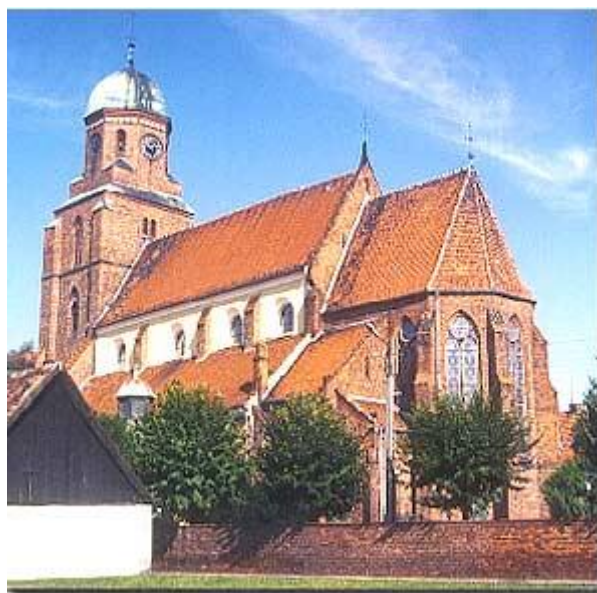
Rysunek 4. Kościół parafialny