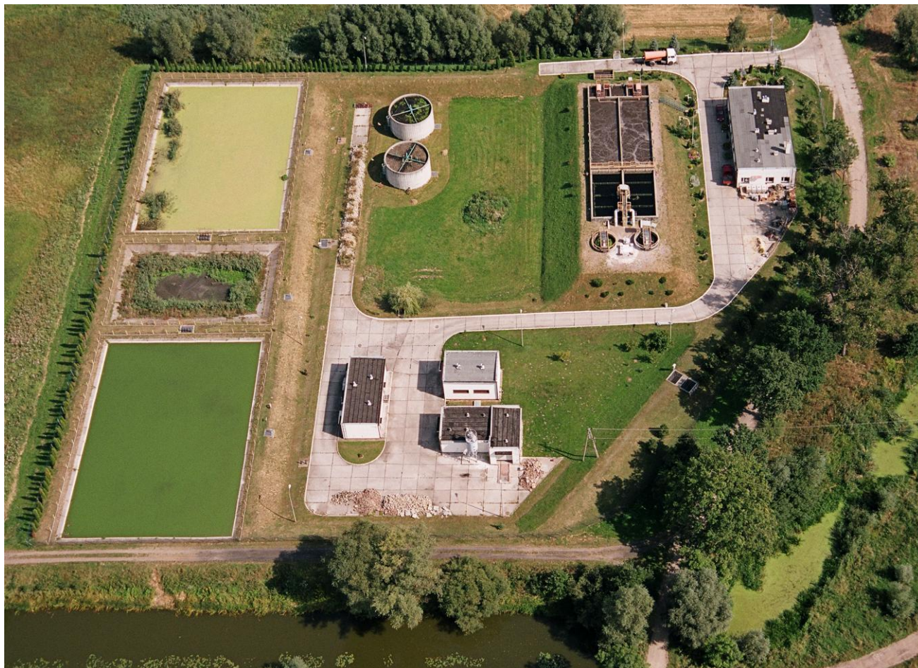
Rysunek 9. Oczyszczalnia ścieków w Żmigrodzie z lotu ptaka

miejsowości. Zadanie to pozwoliło na podłączenie do systemu kanalizacyjnego obsługującego ok. 1200 osób a więc ok. 8 % populacji gminy.