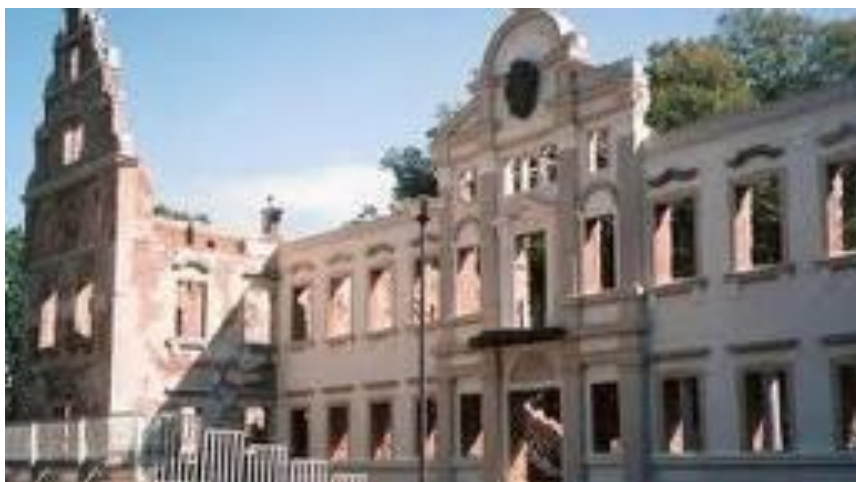
Rysunek nr 10 Ruiny Zamku po modernizacji