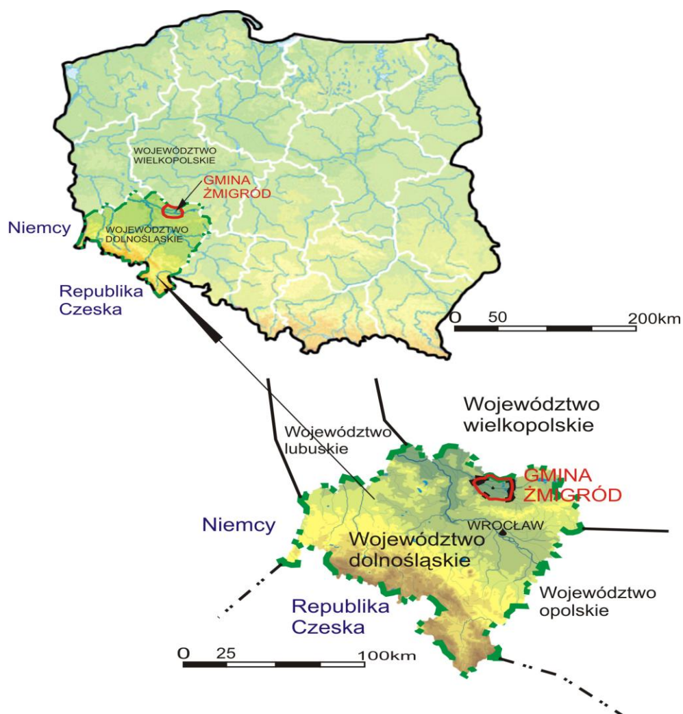
Rysunek 2. Położenie administracyjne Gminy Żmigród

Administracyjnie gmina Żmigród położona jest w województwie dolnośląskim, powiecie trzebnickim. Gmina jest największą terytorialnie w swoim powiecie, zajmuje 28 % obszaru oraz najludniejszą, zamieszkuje ją ponad 40% mieszkańców powiatu. Gmina należy do typowych gmin miejsko-wiejskich z wyraźnie wykształconym ośrodkiem stołecznym. Gmina zajmuje północno-zachodnią część powiatu trzebnickiego leżącego w północnej części Dolnego Śląska. Gmina od wschodu graniczy z gminą Milicz i na niewielkim odcinku z gminą Trzebnica od południa z gminą Prusice od zachodu z gminą Wińsko i Wąsosz zaś od północy z gminą Rawicz, która znajduje się już na obszarze wielkopolski.