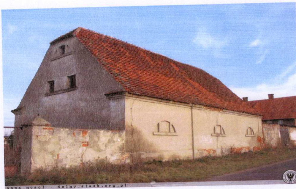
Zdjęcie 4: Spichlerz

Spichlerz z ok. 1830 r. Klasycystyczny. Ustawiony kalenicowo na terenie dawnego folwarku w północnej części wsi i zwrócony frontem na północ. Murowany z cegły, otynkowany, wewnątrz o konstrukcji drewnianej.