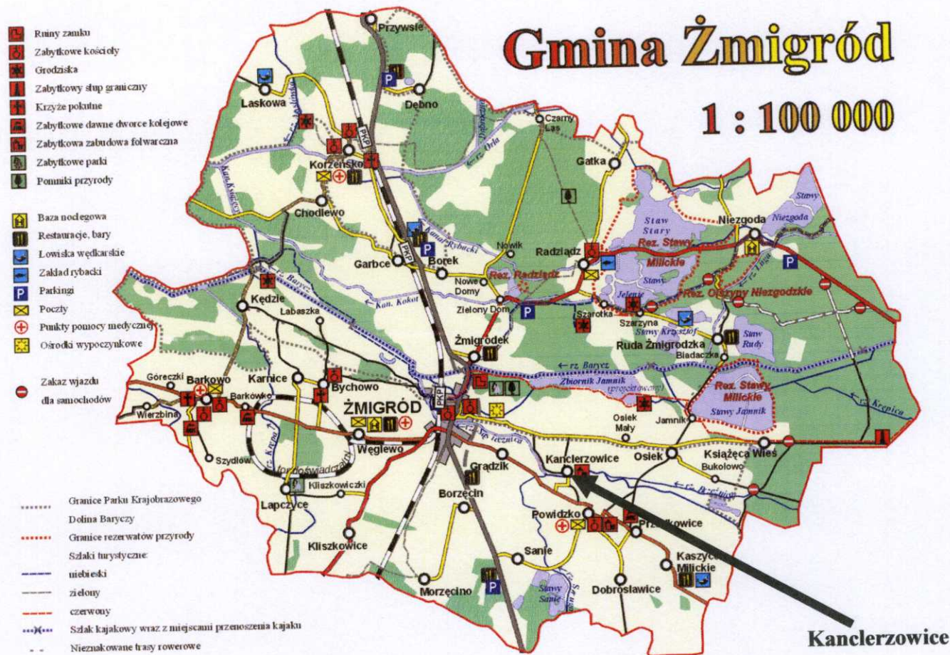
Rys 1. Lokalizacja miejscowości Kanclerzowice na tle Gminy Żmigród.