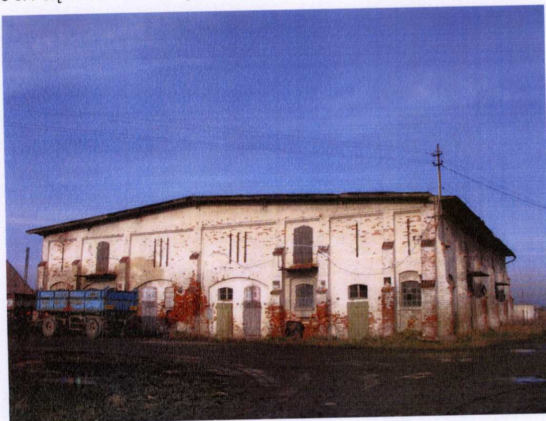
Zdjęcie 5: Potężna obora dawnego folwarku

Spichlerz z ok. 1830 r. Klasycystyczny. Ustawiony kalenicowo na terenie dawnego folwarku w północnej części wsi i zwrócony frontem na północ. Murowany z cegły, otynkowany, wewnątrz o konstrukcji drewnianej.