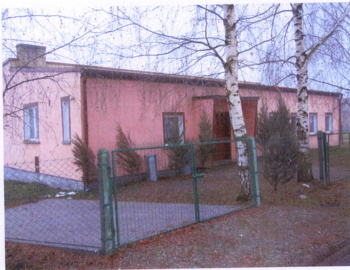
Zdjęcie 7. Budynek świetlicy wiejskiej.

Świetlica zlokalizowana jest na początku wsi od strony wschodniej tuż przy drodze gminnej.