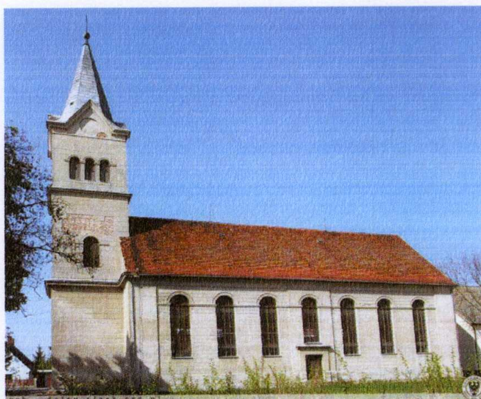
Zdjęcie 6. Kościół pomocniczy św. Antoniego z Padwy

Wzmiankowany w 1333r. Obecny kościół późnobarokowy był wzniesiony w latach 1783-1787. Murowany, jednonawowy z wieżą od zachodu, z węższym krótkim prezbiterium od południa. Restaurowany w 2 połowie XIX wieku, remontowany w latach 1970-1972. W kościele zachowało się bogate wyposażenie z czasów jego budowy oraz gotycka rzeźba Piety i krucyfiks z przełomu XV i XVI w.