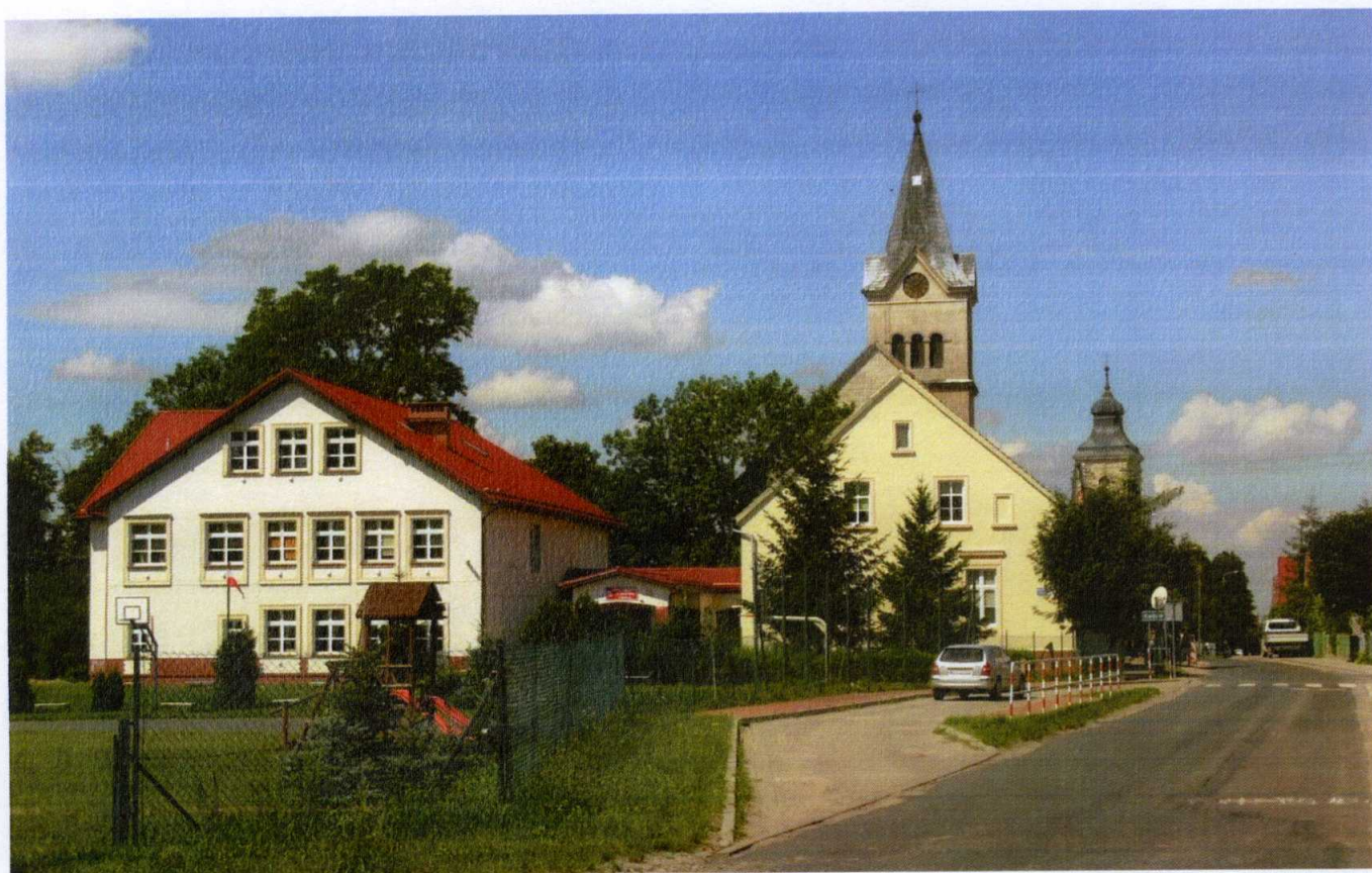
Zdjęcie 2: Szkoła Podstawowa w Barkowie.