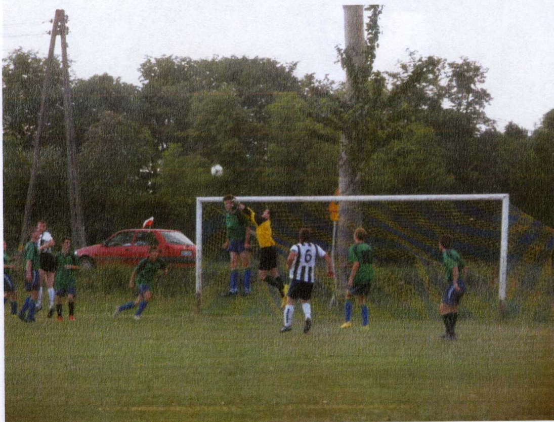
Zdjęcie 3. Mecz drużyny Lech Barkowo.

W samym centrum wsi Barkowo znajduje się budynek, który służy jako świetlica wiejska dla lokalnej społeczności. W poprzednich latach budynek ten przeszedł gruntowny remont.