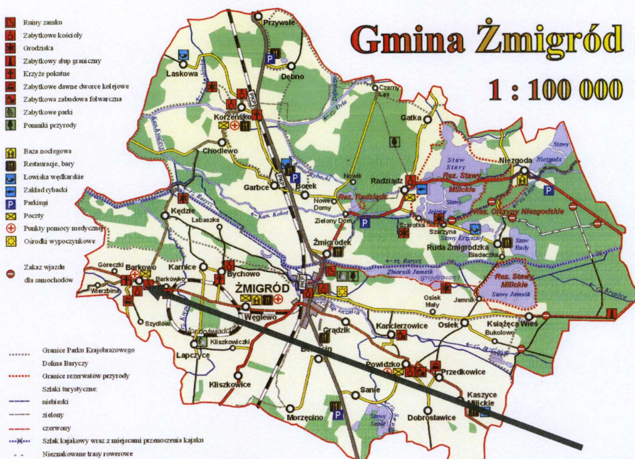
Rys 1. Lokalizacja miejscowości Barkowo na tle Gminy Żmigród.