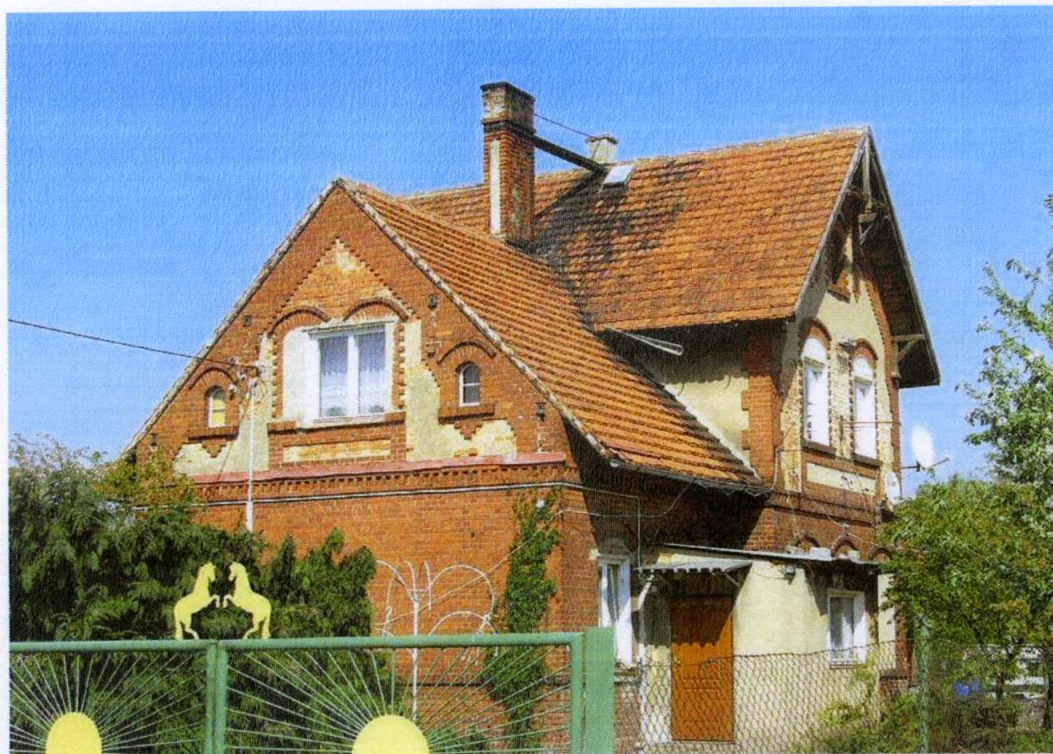
Zdjęcie 1: Budynek starej stacji kolejowej.

W latach poprzednich w Barkowie istniał transport kolejowy na linii kolejowej Żmigród – Wąsosz. Linia została oddana do użytku w 1886 roku. Pociągi przestały kursować 1960r. Definitywnie zlikwidowana 1975r. Większość torowiska została rozebrana.