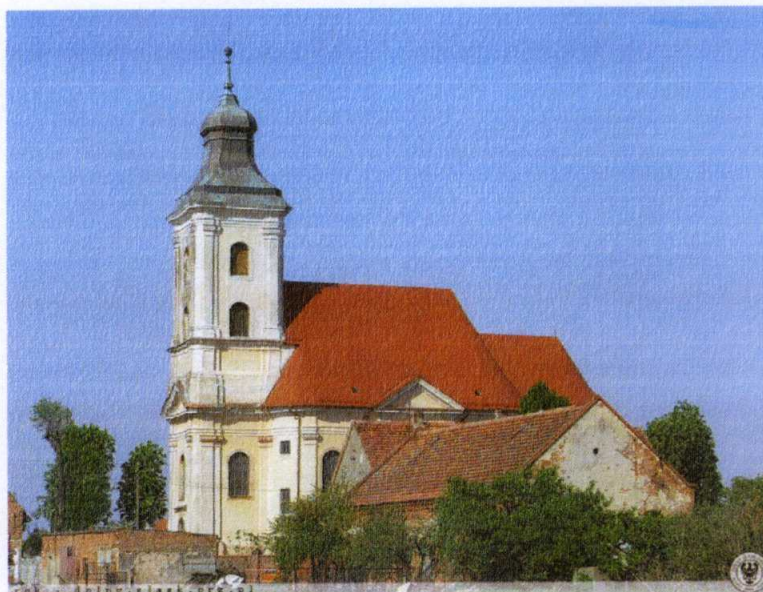
Zdjęcie 5. Kościół św. Marcina

Wzmiankowany w 1333r. Obecny kościół późnobarokowy był wzniesiony w latach 1783-1787. Murowany, jednonawowy z wieżą od zachodu, z węższym krótkim prezbiterium od południa. Restaurowany w 2 połowie XIX wieku, remontowany w latach 1970-1972. W kościele zachowało się bogate wyposażenie z czasów jego budowy oraz gotycka rzeźba Piety i krucyfiks z przełomu XV i XVI w.