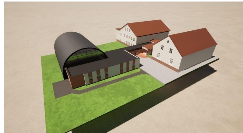
Wizualizacje dwóch inwestycji, których realizacja rozpocznie się w 2024 r.: hostelu w Zespole Pałacowo-Parkowym oraz hali sportowej przy Szkole Podstawowej w Barkowie